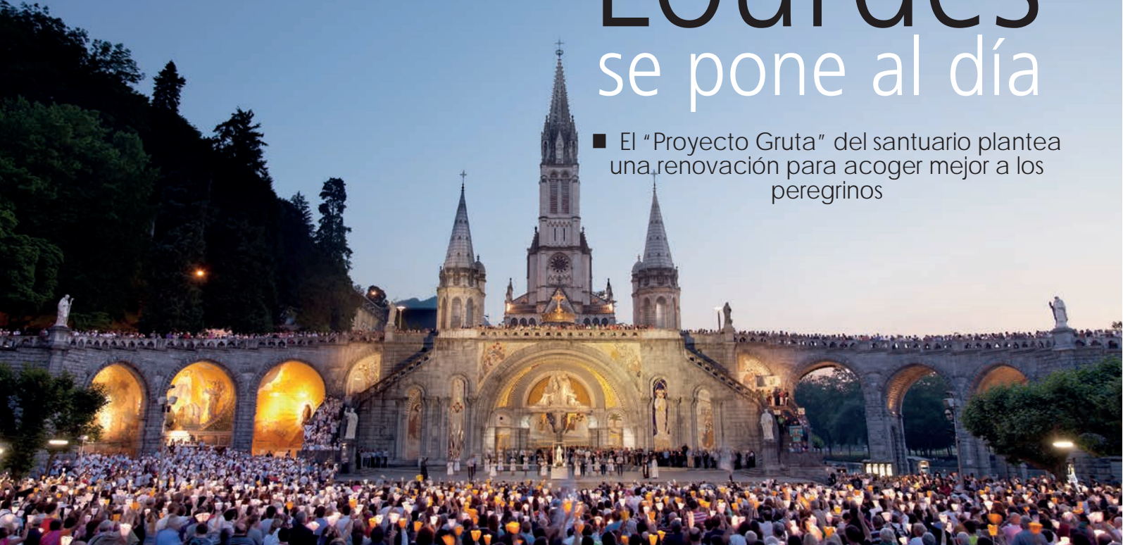
Procesión de las antorchas, en la explanada, el pasado 11 de abril.

■ El "Proyecto Gruta" del santuario plantea una renovación para acoger mejor a los peregrinos