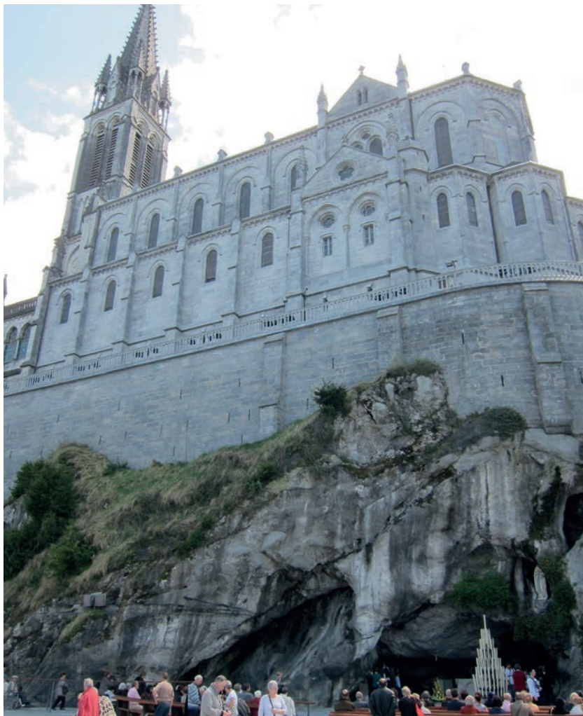
Vista de la basílica superior, con la Gruta en primer plano

El próximo 10 de mayo es el primer jalón de esta nueva etapa. Se inaugura la nueva presentación del manantial de Lourdes, en la Gruta. Las indicaciones de la Virgen mostraron el lugar exacto donde Bernadette Subirous el 25 de febrero de 1858 tuvo que escarbar en el suelo para sacar a la luz ese manantial, que es el punto central de todo el santuario. Nunca como hasta ahora se había mostrado de una manera tan visible. La Gruta es uno de esos cinco espacios que se renovarán. El obispo de Lourdes explica: “Hay que hacer que el recorrido sea más claro para el visitante. En primer lugar ir a la Gruta, ponerse de rodillas, como Bernadette , rezar y, después, hacer el gesto del agua”. Se busca además, crear un ambiente de recogimiento (“la Gruta debe ser un oasis de silencio. Aquel que hace silencio puede ponerse a la escucha de la Palabra de Dios”, asegura). La reforma prevé que el vasto espacio ante la roca tenga el suelo ligeramente inclinado, para diferenciar la